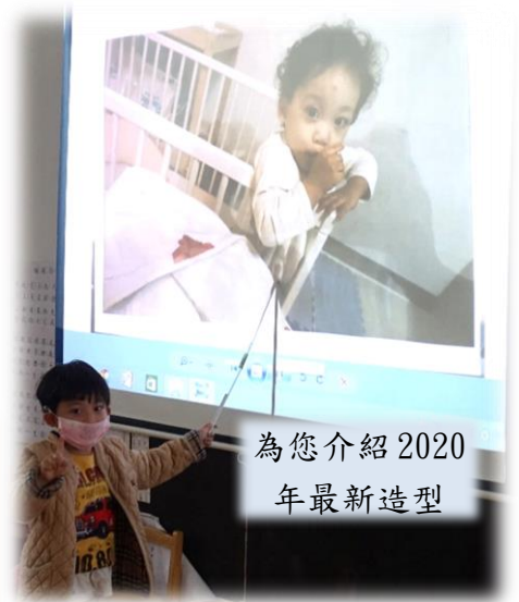
為您介紹 2020 年最新造型