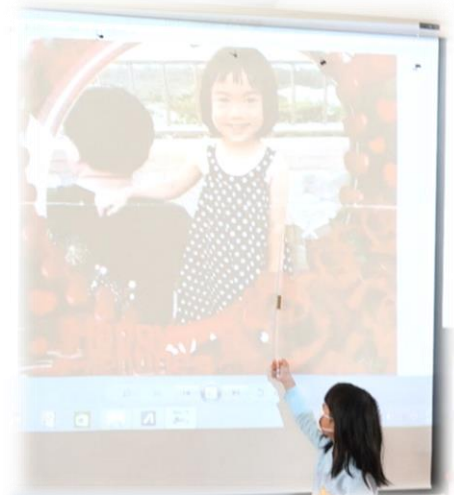
成功的爸爸背後都有一個可愛的女兒