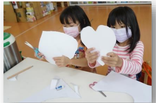
討論想要設計成陀螺的造型