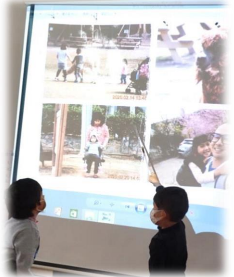
我和我歡樂的一家