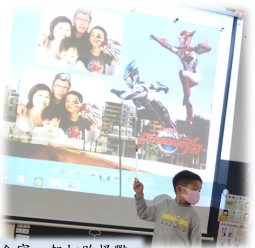
全家一起打敗怪獸